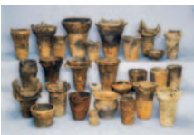
国指定重要文化財の深鉢形土器